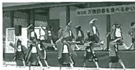
千代田中ソーランの様子