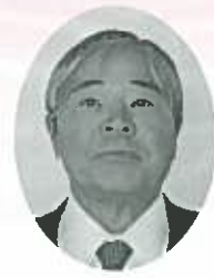
北広島町社会福祉協議会