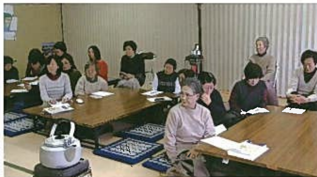
川戸いきいきサロン (広島県金融委員会による無料講座の様子) (関連記事は2ページをご覧ください)