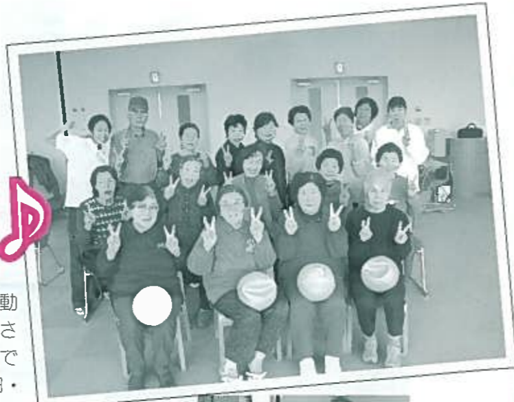
千代田教室の様子