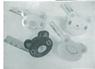
参加賞・シューズクリップ